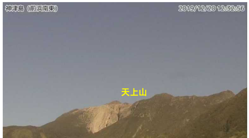
図 2 神津島 天上山山頂部の状況 （12 月 20 日、前浜南東監視カメラによる）

GNSS 基線 ~ は図 3 の ~ に対応しています。 神津島 1 から神津島 1A に 2014 年 9 月 19 日移設。