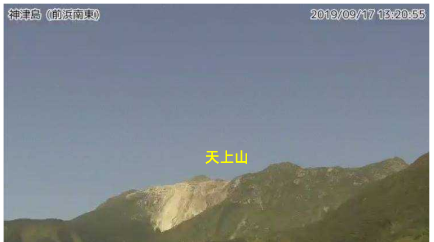
図2 神津島 天上山山頂部の状況 （9月17日、前浜南東監視カメラによる）