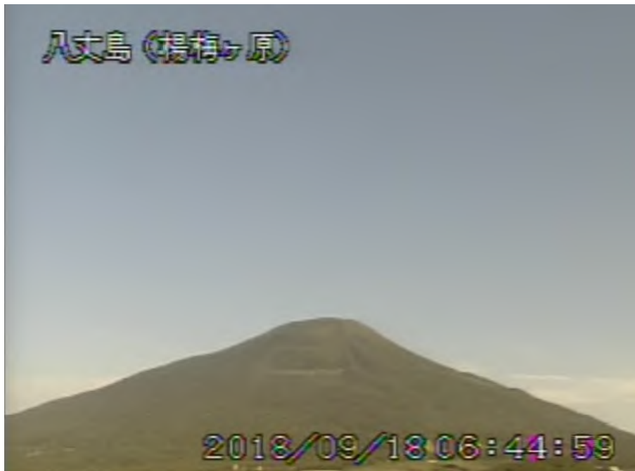
図 1 八丈島 西山山頂部の状況 (9月18日、楊梅ヶ原 ようめがはら 監視カメラによる)

1) GNSS (Global Navigation Satellite Systems) とは、GPSをはじめとする衛星測位システム全般を示す呼称です。