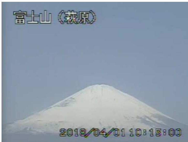
図 1 富士山 山頂部の状況 （4月1日 萩原監視カメラによる）

1) GNSS (Global Navigation Satellite Systems) とは、GPS をはじめとする衛星測位システム全般を示す呼称です。