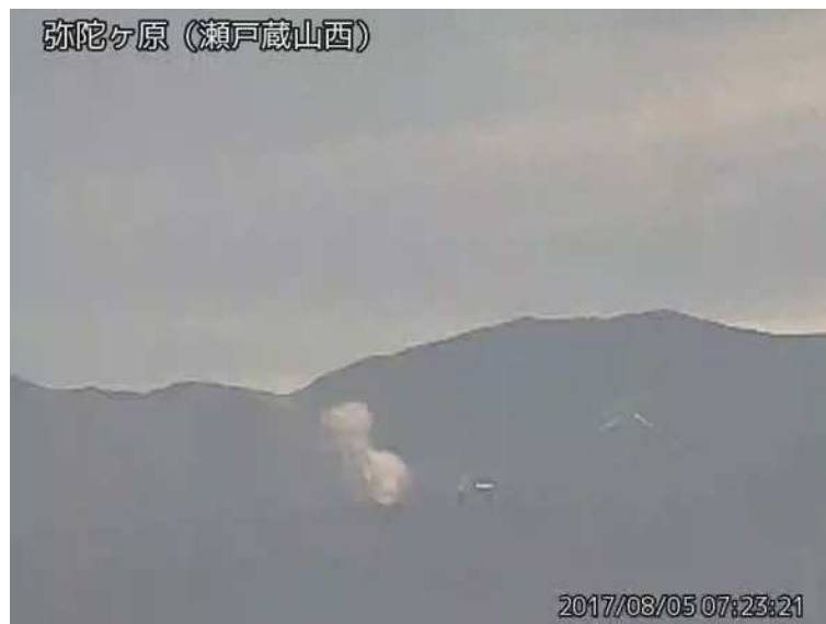
図 1 弥陀ヶ原 地獄谷からの噴気の状況 （8 月 5 日、瀬戸蔵山西監視カメラによる）

弥陀ヶ原近傍を震源とする火山性地震の発生回数は少なく、地震活動は低調に経過しています。火山性微動は観測されていません。