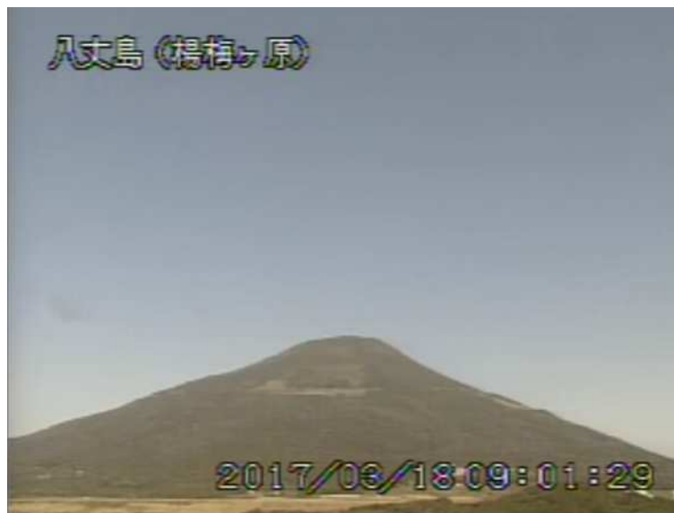
図 1 八丈島 西山山頂部の状況 (3月18日 楊梅ヶ原 ようめがはら 監視カメラによる)

1) GNSS (Global Navigation Satellite Systems) とは、GPS をはじめとする衛星測位システム全般を示す呼称です。