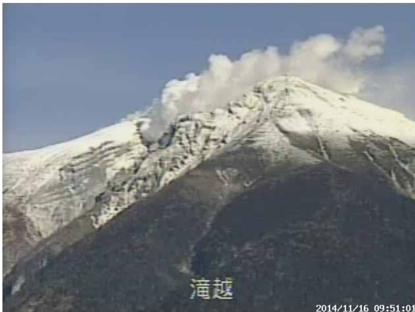
図 2 御嶽山 噴煙の状況

( 11 月 16 日 09 時 51 分 剣ヶ峰の南南西約 6 km の中部地方整備局の滝越カメラによる ) ・ 11 月 16 日 10 時には、噴煙の高さは火口縁上 200m で南東に流れています。