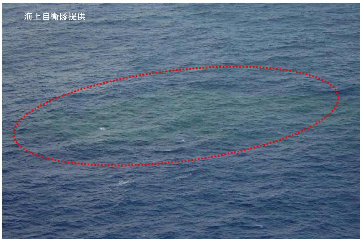
図2 福德岡ノ場 16日10時32分頃の福德岡ノ場付近の状況

16日の海上自衛隊による上空からの観測により、福德岡ノ場の湧出点から東方向へ約1,850mに伸びる緑色の変色水域（図中赤丸）が確認されました。