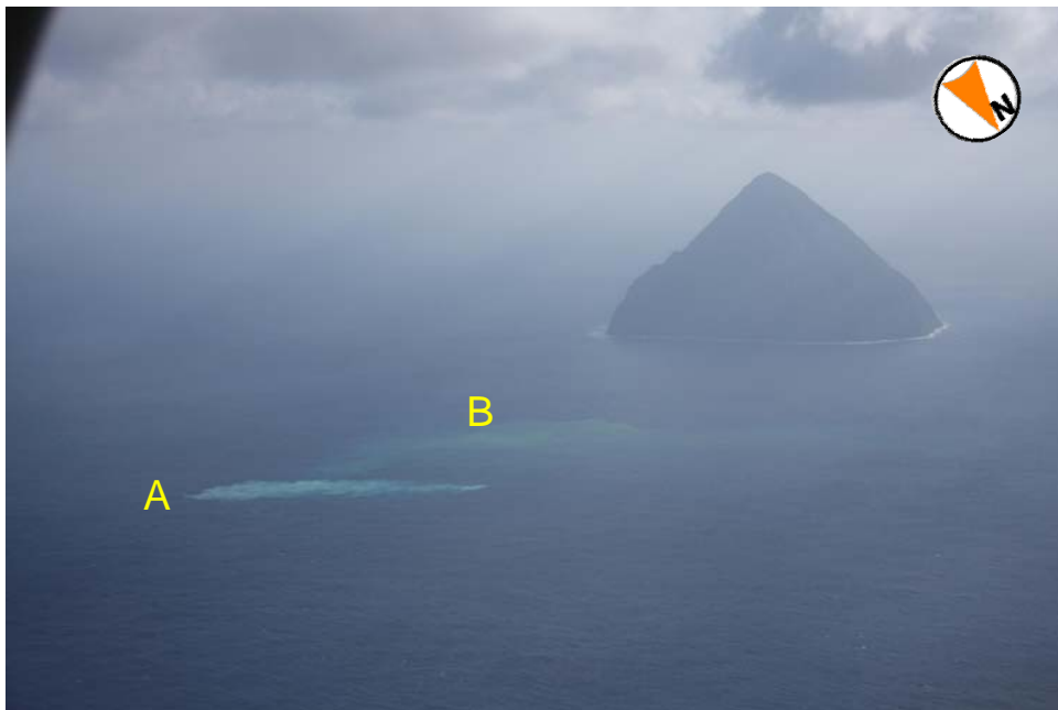
図 3 福徳岡ノ場 南硫黄島の北東上空 1120mより撮影 撮影日時：2011 年 1 月 28 日 15 時 04 分 A：白濁の変色域、B：薄い茶色の変色域