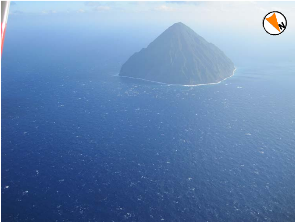
図 2 福徳岡ノ場 南硫黄島の北東上空 500mより撮影 撮影日時：2011 年 11 月 17 日 14 時 50 分 変色水、浮遊物は確認できませんでした。