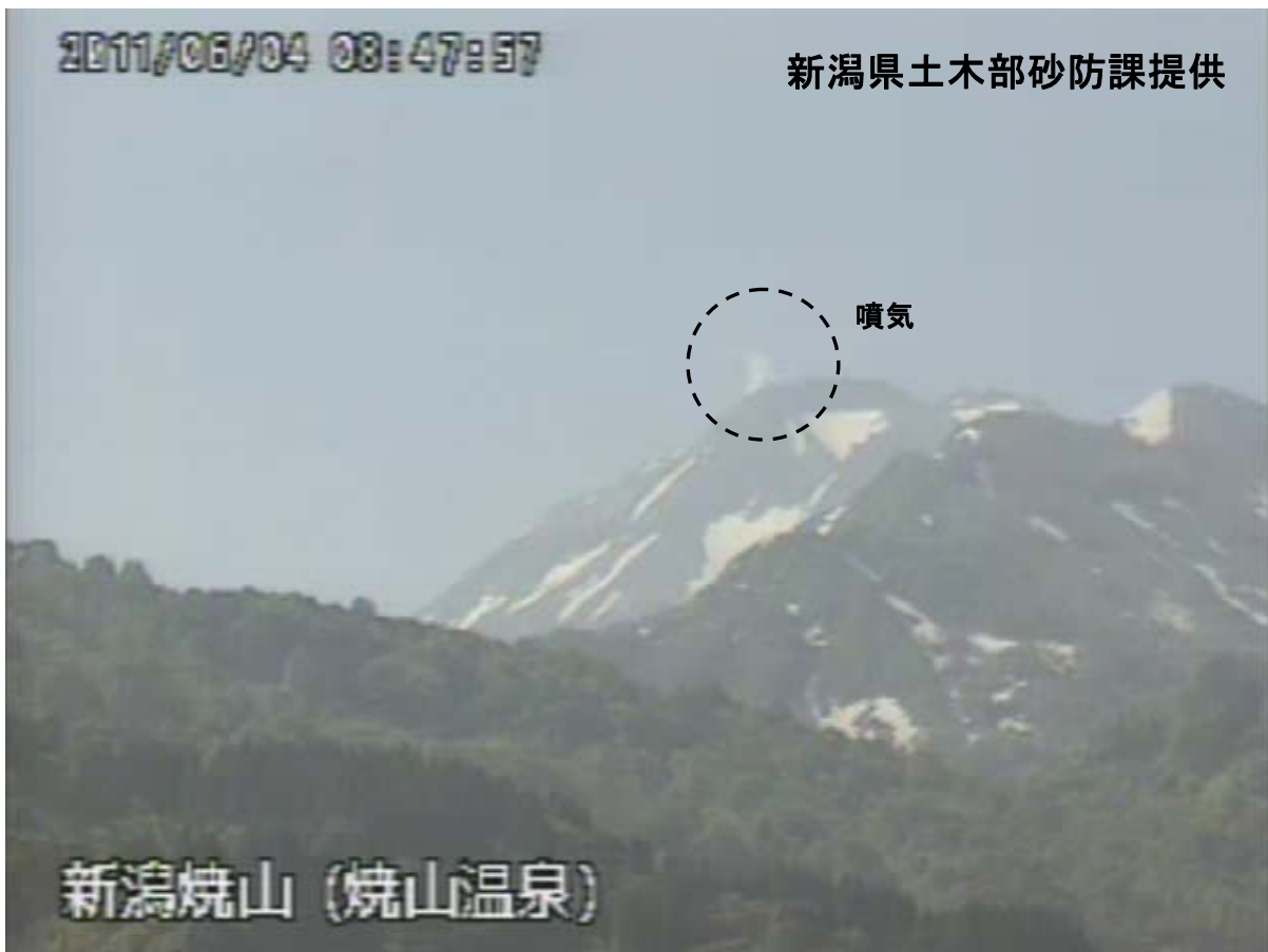
図 1※ 新潟焼山 山頂部の状況（6 月 4 日、山頂の北北西約 8 km にある焼山温泉監視カメラによる）

新潟焼山付近を震源とする地震の発生回数は少なく、地震活動は静穏に経過しました。 火山性微動は観測されませんでした。