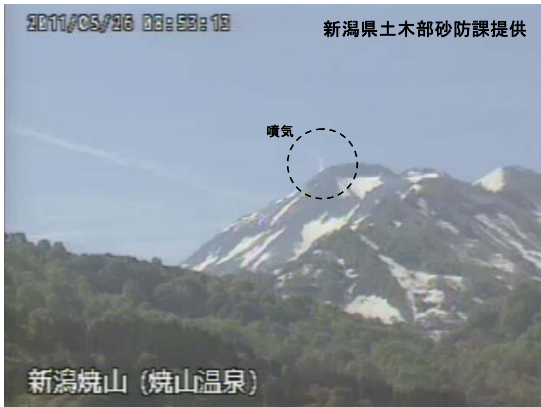
図 1※ 新潟焼山 山頂部の状況（5 月 26 日、山頂の北北西約 8 km にある焼山温泉監視カメラによる）

新潟焼山付近を震源とする地震の発生回数は少なく、地震活動は静穏に経過しました。 火山性微動は観測されませんでした。