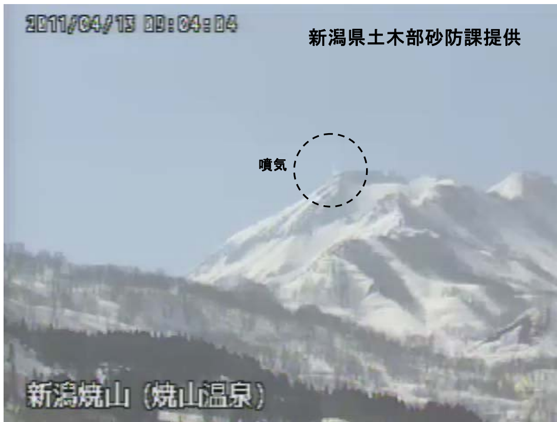
図 1※ 新潟焼山 山頂部の状況（4 月 13 日、山頂の北北西約 8 km にある焼山温泉監視カメラによる）

新潟焼山付近を震源とする地震の発生回数は少なく、地震活動は静穏に経過しました。 火山性微動は発生しませんでした。