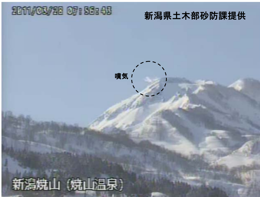
図 1※ 新潟焼山 山頂部の状況（3月28日、山頂の北北西約8kmにある焼山温泉監視カメラによる）

新潟焼山付近を震源とする地震の発生回数は少なく、地震活動は静穏に経過しました。 火山性微動は観測されませんでした。