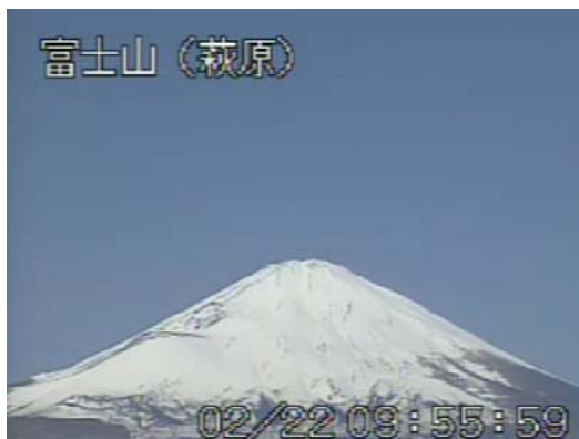
図 2 富士山 山頂部の状況 (2 月 22 日 萩原遠望カメラによる)

この火山活動解説資料は気象庁ホームページ ( http://www.seisvol.kishou.go.jp/tokyo/volcano.html ) でも閲覧することができます。次回の火山活動解説資料（平成 23 年 3 月分）は平成 23 年 4 月 8 日に発表する予定です。