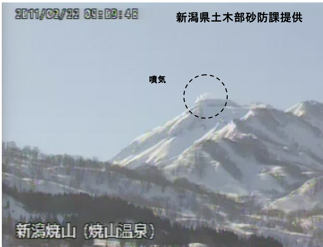
図 1※ 新潟焼山 山頂部の状況（2月22日、山頂の北北西約8kmにある焼山温泉監視カメラによる）

新潟焼山付近を震源とする地震の発生回数は少なく、地震活動は静穏に経過しました。 火山性微動は観測されませんでした。