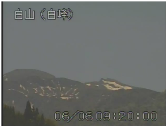
図 1 白山 山頂部の状況 （6 月 6 日）

なお、今回の地震活動に伴って火山性微動の発生等、火山活動に特段の変化はみられませんでした。