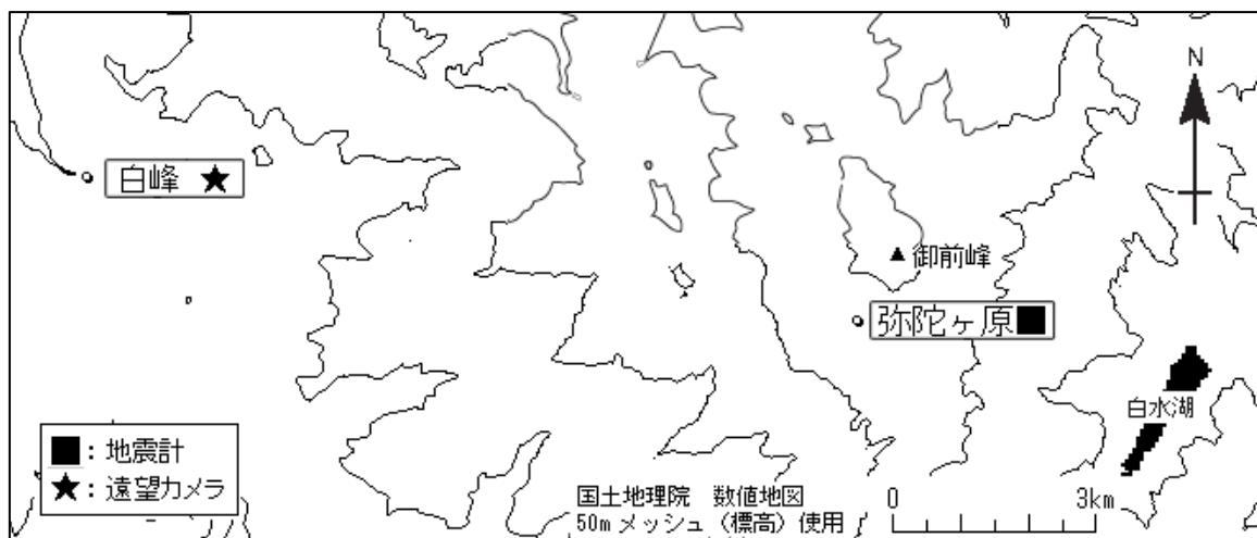
図 2 白山 気象庁の観測点配置図（小さな白丸は観測点位置を示しています）

この火山活動解説資料は気象庁ホームページ ( http://www.seisvol.kishou.go.jp/tokyo/volcano.html ) でも閲覧することができます。次回の火山活動解説資料（平成 22 年 7 月分）は平成 22 年 8 月 5 日に発表する予定です。