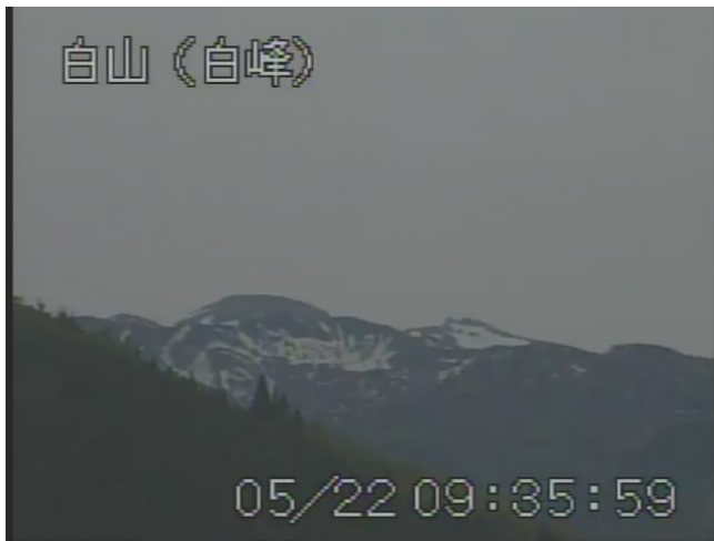
図 1 白山 山頂部の状況 （5 月 22 日 白峰カメラによる）

白山付近を震源とする地震の発生回数は少なく、地震活動は静穏に経過しました。 火山性微動は観測されませんでした。