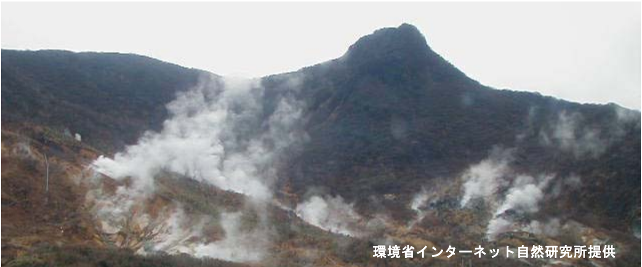
図 2※ 箱根山 大涌谷の状況（2月27日）