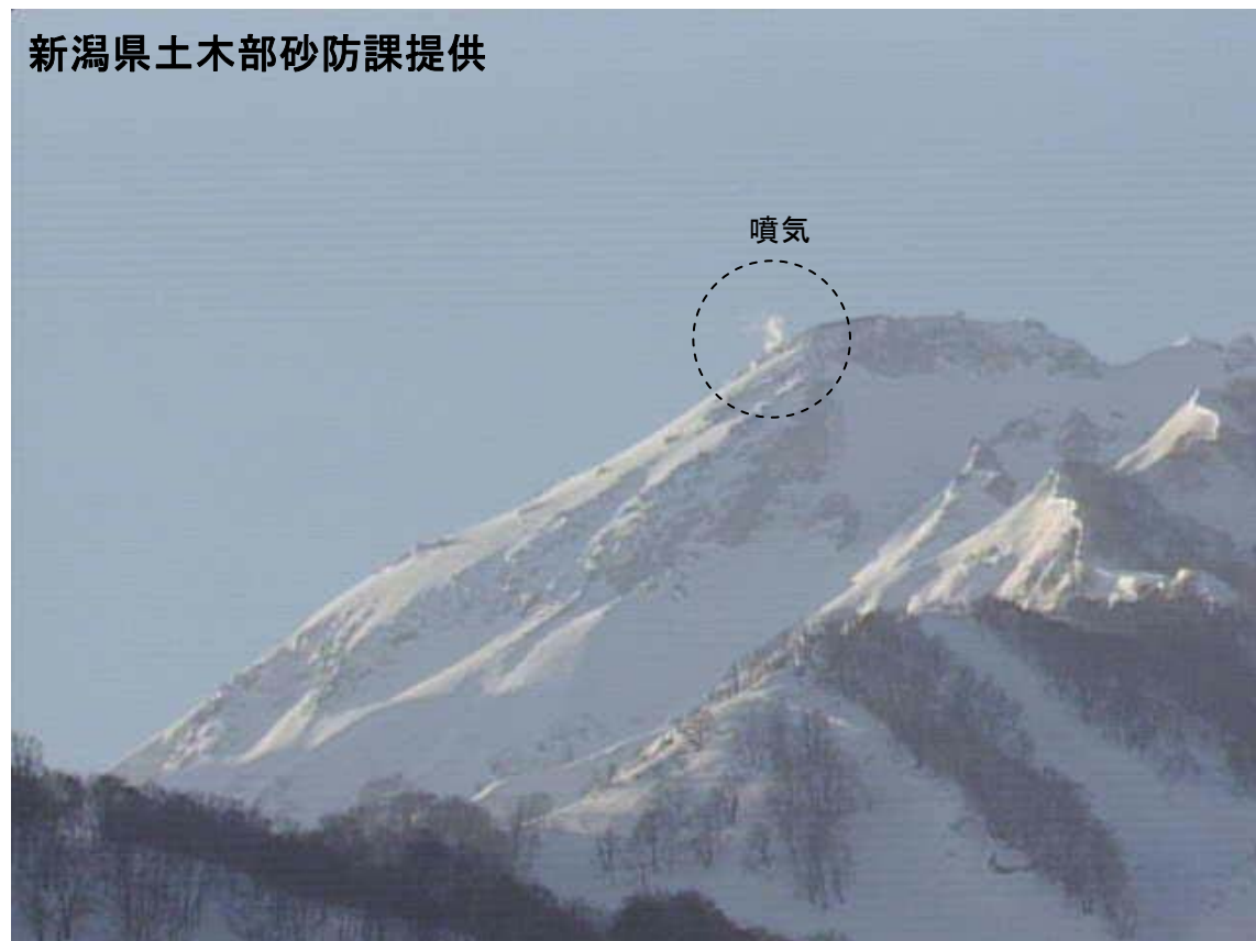
図 1※ 新潟焼山 山頂部の状況（2月24日、山頂の北北西約8kmにある焼山温泉監視カメラによる）

新潟焼山付近を震源とする地震の発生回数は少なく、地震活動は静穏に経過しました。火山性微動は観測されませんでした。