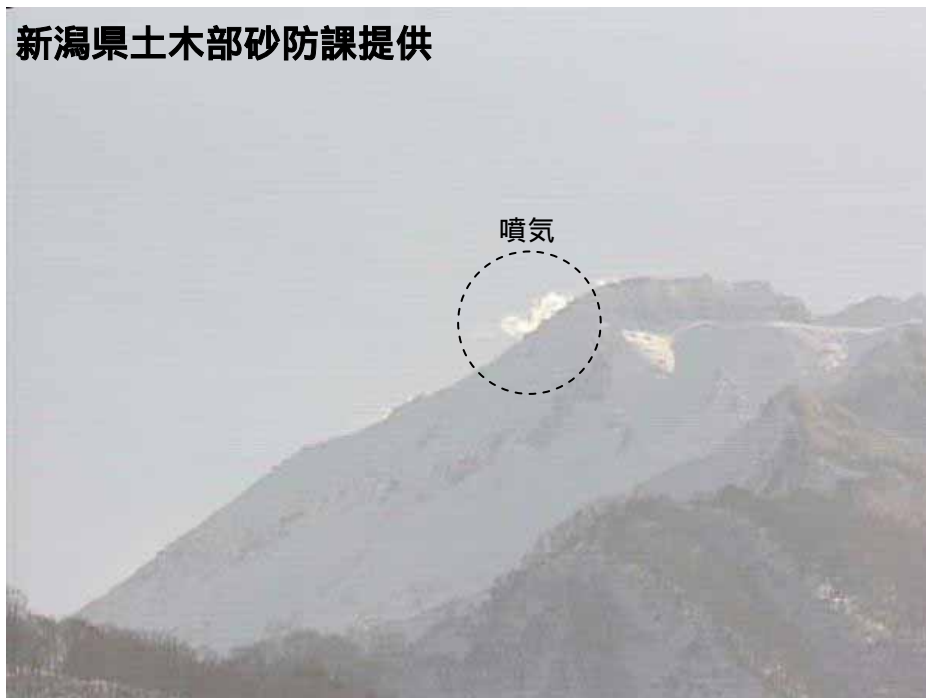
図 1 新潟焼山 山頂部の状況（12 月 25 日、山頂の北北西約 8 km にある焼山温泉監視カメラによる）

新潟焼山付近を震源とする地震の発生回数は少なく、地震活動は静穏に経過しました。 火山性微動は観測されませんでした。