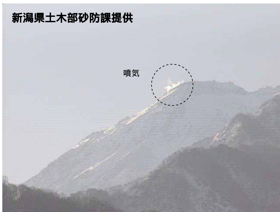
図 1 新潟焼山 山頂部の状況（11 月 23 日、山頂の北北西約 8 km にある焼山温泉監視カメラによる）

新潟焼山付近を震源とする地震の発生回数は少なく、地震活動は静穏に経過しました。 火山性微動は観測されませんでした。