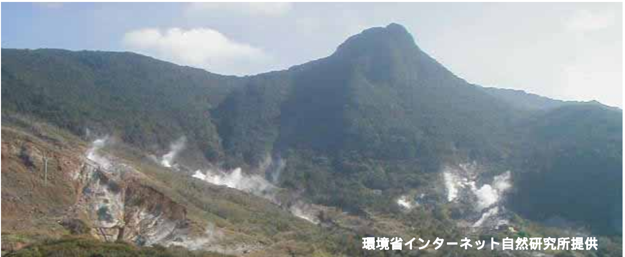
図2 大涌谷の状況（9月17日、環境省インターネット自然研究所の箱根・大涌谷カメラによる）