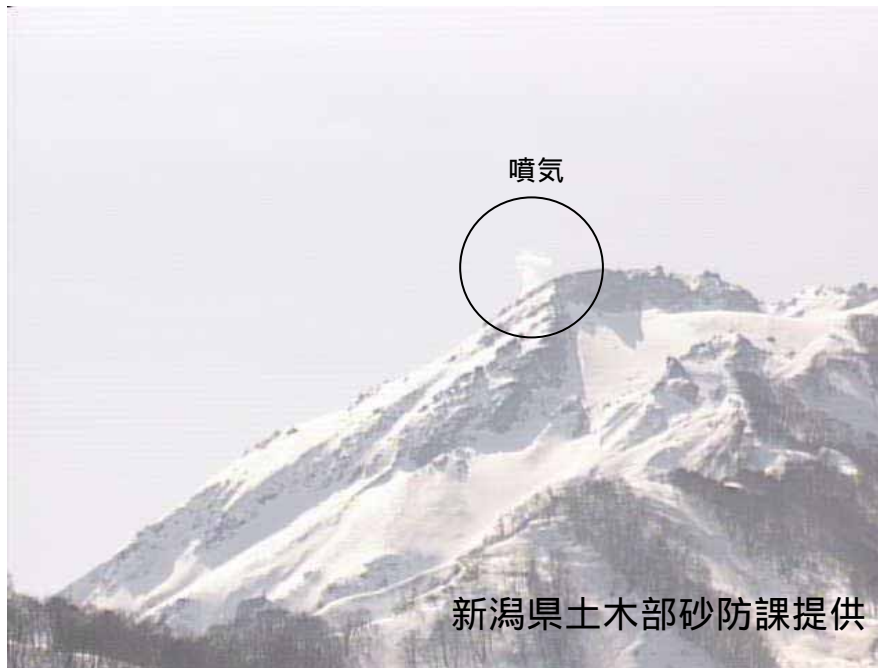
図 1 新潟焼山 北側から見た山頂部の状況（3月5日、焼山温泉監視カメラによる） 黒円内は従来から見られている山頂部東側斜面の弱い噴気です。

新潟焼山付近を震源とする地震の発生回数は少なく、地震活動は静穏に経過しました。 火山性微動は観測されませんでした。