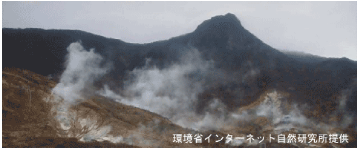
図 2※ 大涌谷の状況（12 日、環境省インターネット自然研究所の箱根・大涌谷カメラによる）