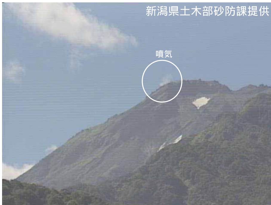
図 1 新潟焼山 北側から見た山頂部の状況（7 月 21 日、焼山温泉監視カメラによる） 白円内は従来から見られている弱い噴気です。

新潟焼山付近を震源とする地震の発生回数は少なく、地震活動は静穏に経過しました。 火山性微動は観測されませんでした。