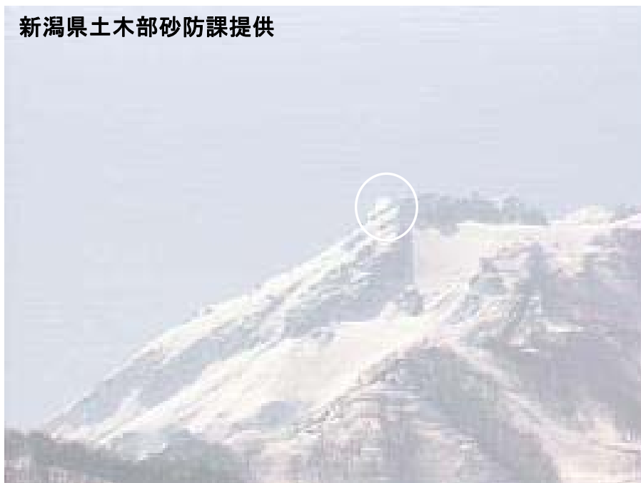
図 1 ※ 新潟焼山 北側から見た山頂部の状況（3 月 18 日、焼山温泉監視カメラによる） 白円内は従来から見られている弱い噴気です。

新潟焼山付近を震源とする地震は観測されず、地震活動は静穏に経過しました。 火山性微動は観測されませんでした。