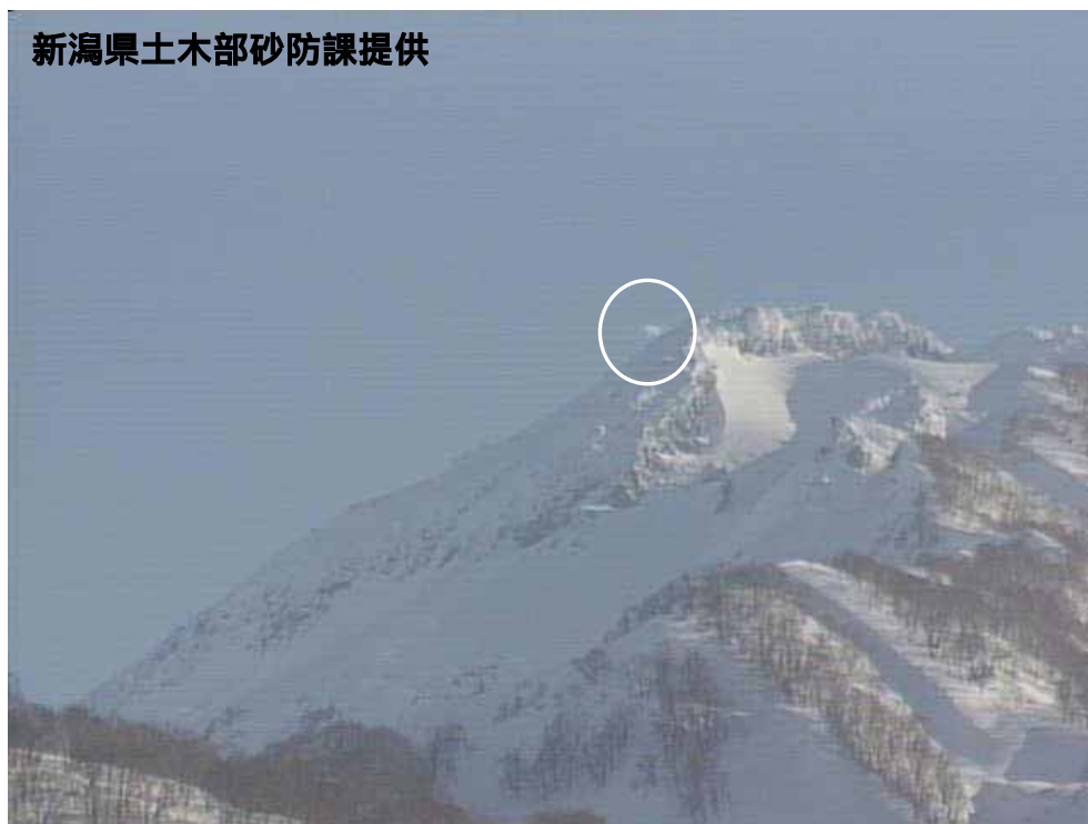
図 1 新潟焼山 北側から見た山頂部の状況（2 月 21 日、焼山温泉監視カメラによる） 白円内は従来から見られている弱い噴気です。

新潟焼山付近を震源とする地震は観測されず、地震活動は静穏に経過しました。 火山性微動は観測されませんでした。