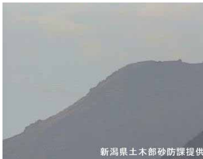
図 3 新潟焼山 山頂部の状況（9月30日、焼山温泉側から撮影）