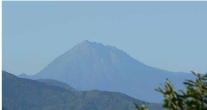
図 2 新潟焼山 山頂部の状況（9月23日、北東約37～38kmの地点から撮影）