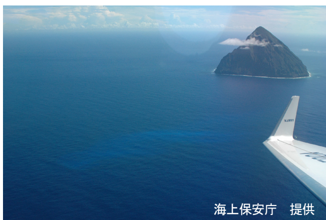
図1 福德岡ノ場 変色水の様子（2005年10月3日） 青白色の変色水が確認された。右後方は南硫黄島。

福德岡ノ場では以前から変色水が度々確認されており、今年7月2日～3日には小規模な海底噴火が発生して、その後もしばしば変色水が確認されていました。