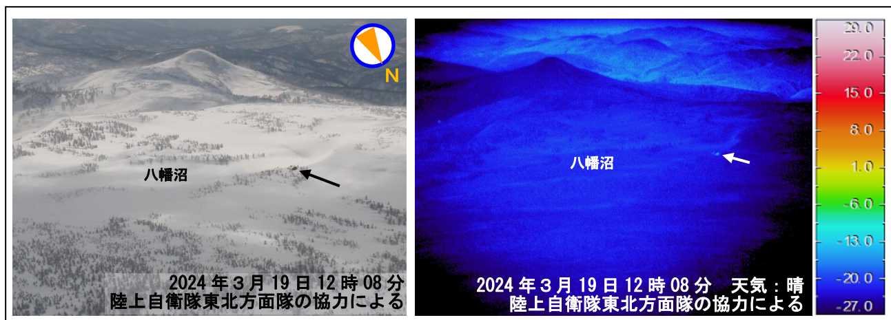
図3 八幡平 上空から撮影した八幡沼周辺の状況と地表面温度分布