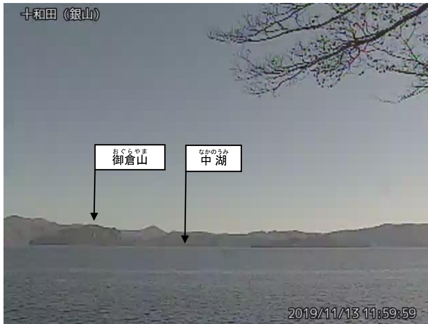
図1 十和田 中湖周辺の状況（11月13日） ・ 銀山監視カメラ（中湖の北西約6km）の映像です。