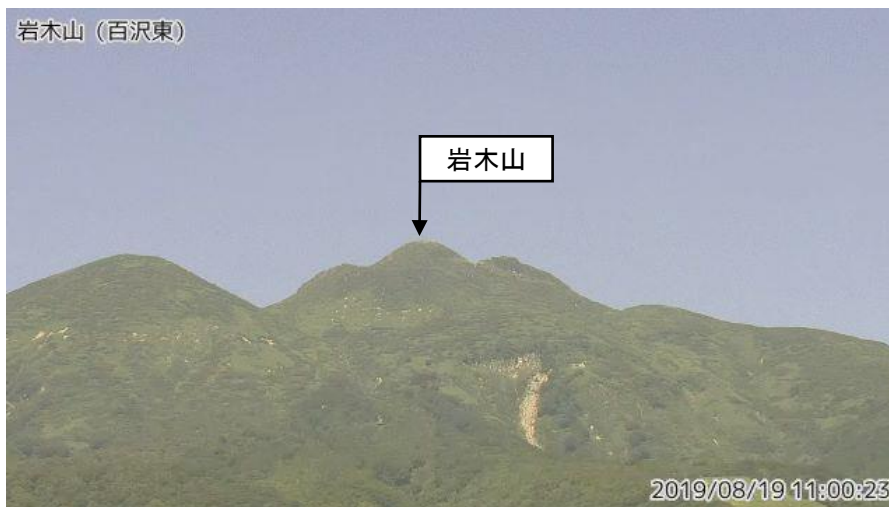
図1 岩木山 山頂部の状況（8月19日）