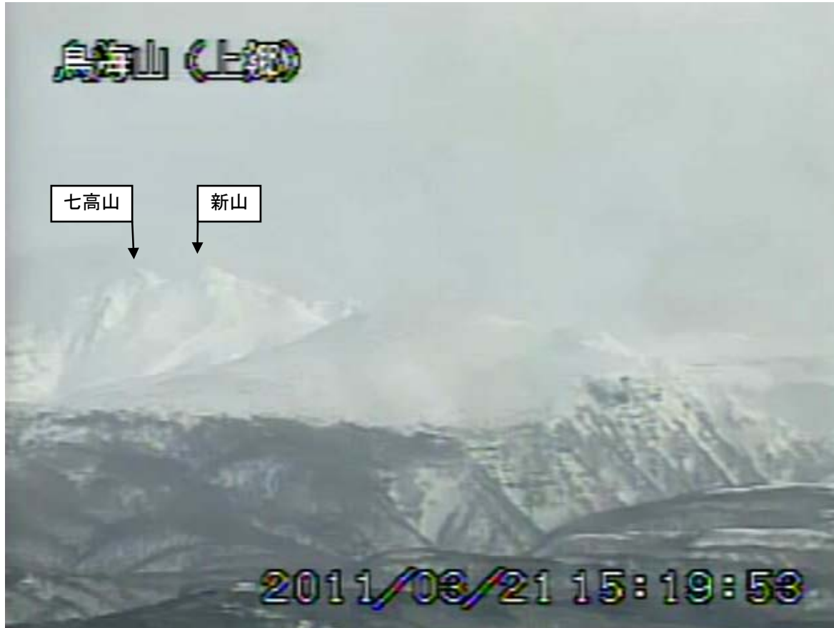
図2 鳥海山 遠望カメラの映像（3月21日15時20分頃） 上郷（山頂の北西約10km）に設置してある遠望カメラによる。