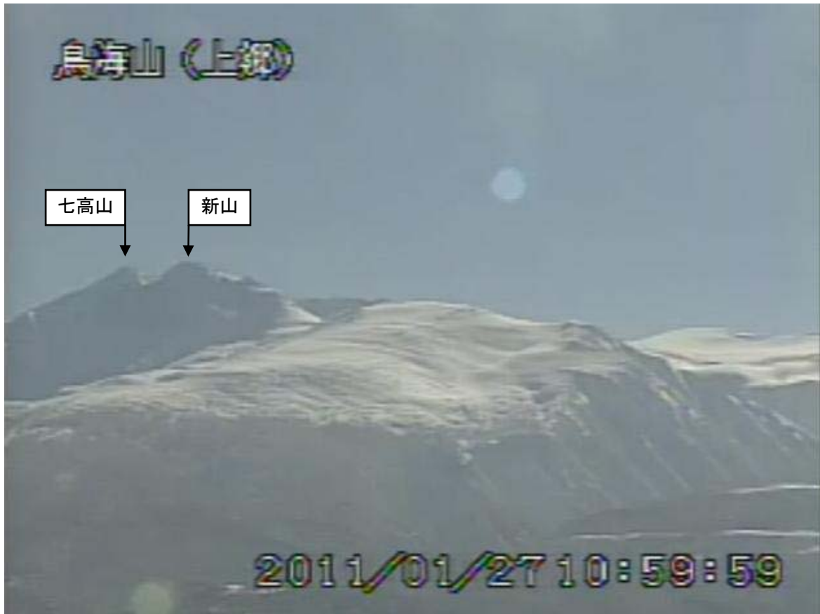
図2 鳥海山 遠望カメラの映像（1月27日11時00分頃） 上郷（山頂の北西約10km）に設置してある遠望カメラによる。