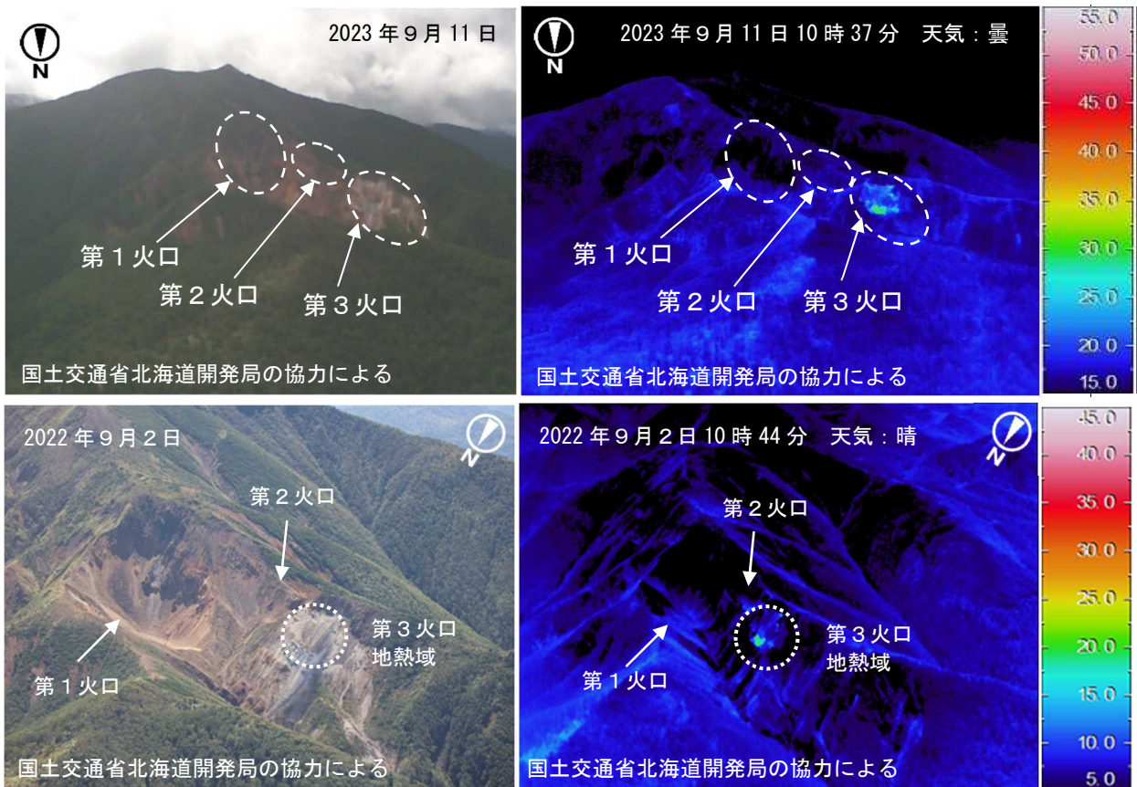
図3 丸山 赤外熱映像装置による第1火口～第3火口の地表面温度分布 上段：北側上空（図1の②）から撮影 下段：北西側上空（図1の③）から撮影 ・第3火口の地熱域（点線で囲まれた領域）の地表面温度分布は、前回の観測（2022年9月）と比べて特段の変化はありませんでした。