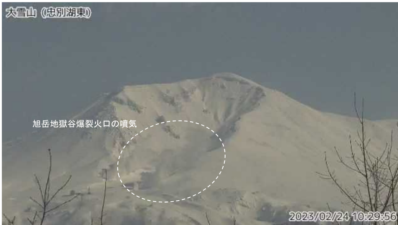
図2 大雪山 西側から見た旭岳の状況（ ちゅうべつこひがし 忠別湖東監視カメラによる）