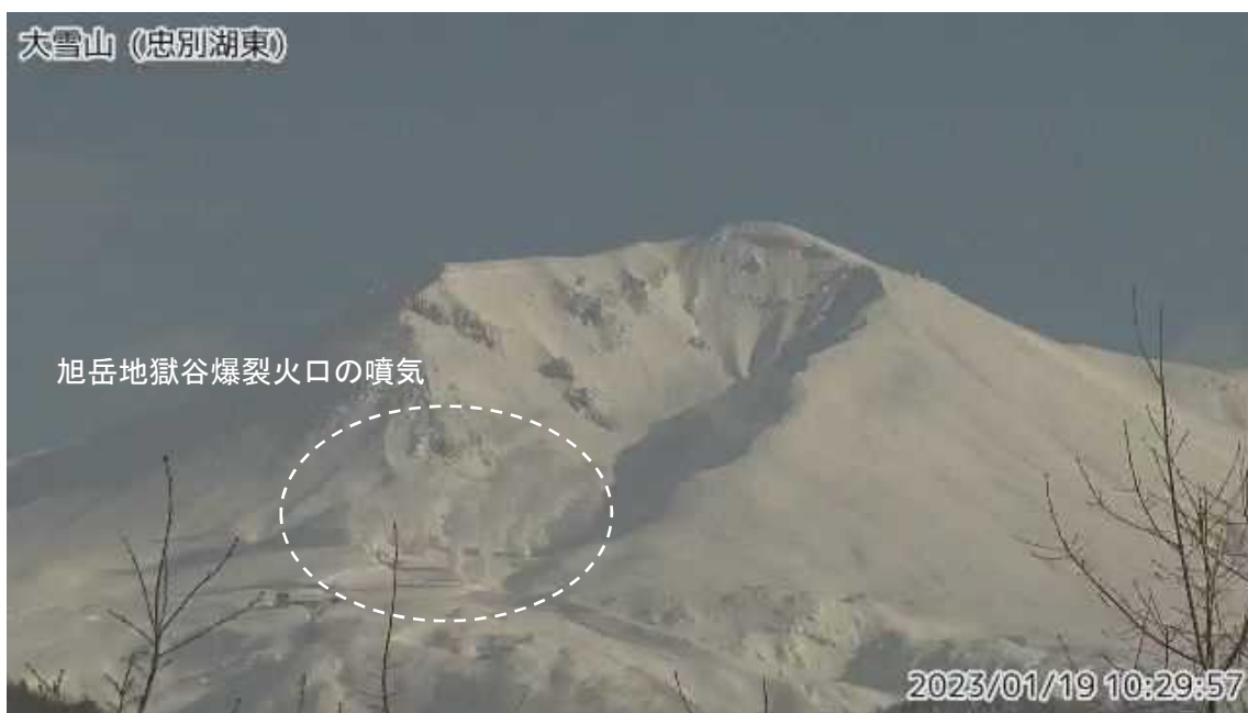
図2 大雪山 西側から見た旭岳の状況（ ちゅうべつこひがし 忠別湖東監視カメラによる）