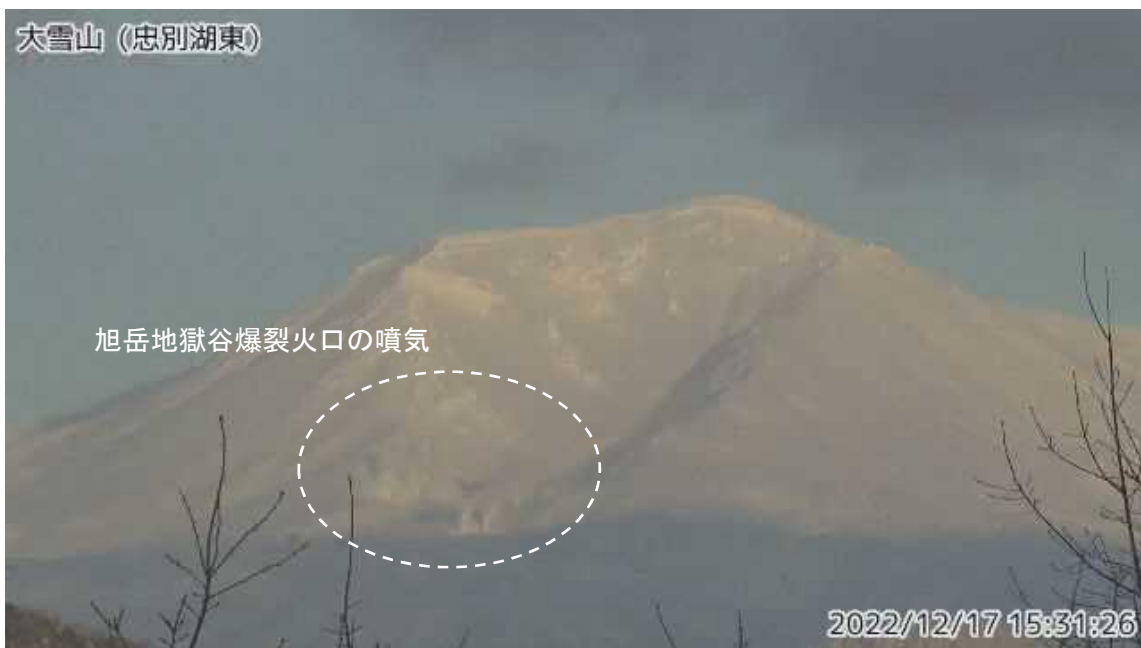
図2 大雪山 西側から見た旭岳の状況（ ちゅうべつこひがし 忠別湖東監視カメラによる）