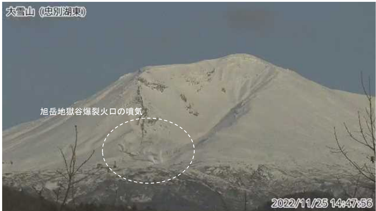
図2 大雪山 西側から見た旭岳の状況（ ちゅうべつこひがし 忠別湖東監視カメラによる）