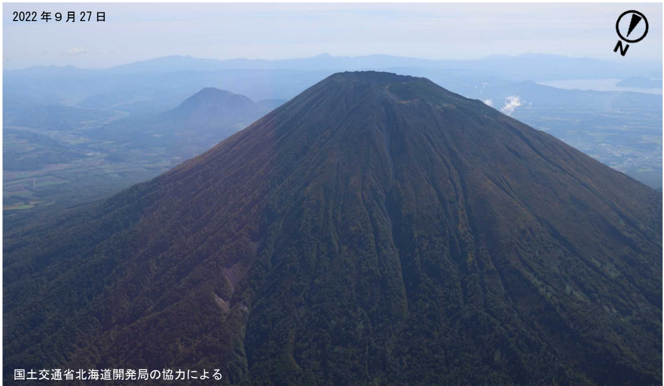
図2 羊蹄山 山体全体の状況 北西側上空（図1の①）から撮影