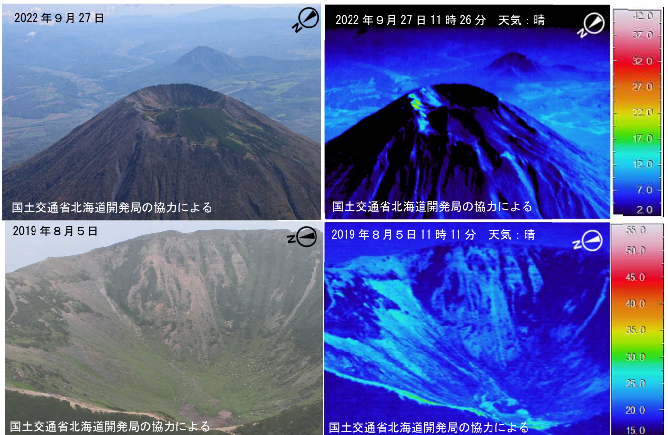
図3 羊蹄山 赤外熱映像装置による山頂火口の地表面温度分布