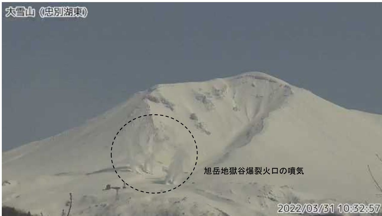
図2 大雪山 西側から見た旭岳の状況（忠別湖東監視カメラによる）