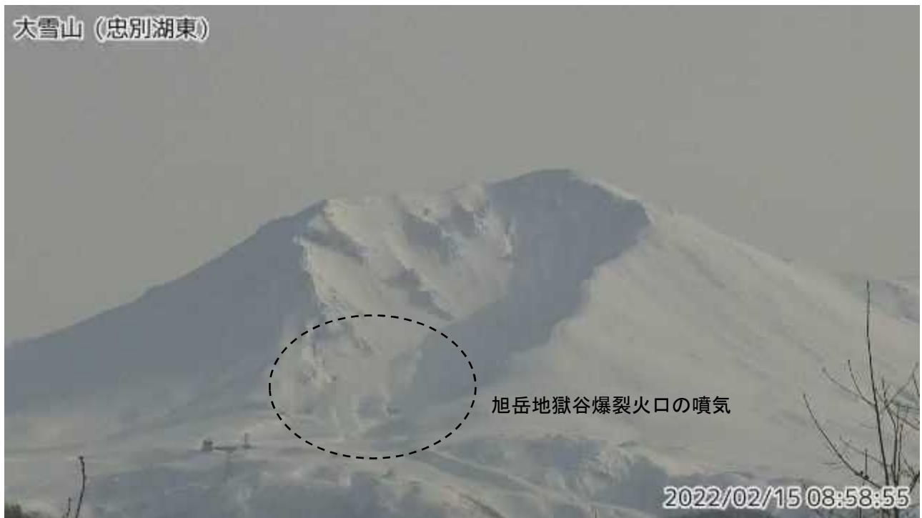
図2 大雪山 西側から見た旭岳の状況（忠別湖東監視カメラによる）