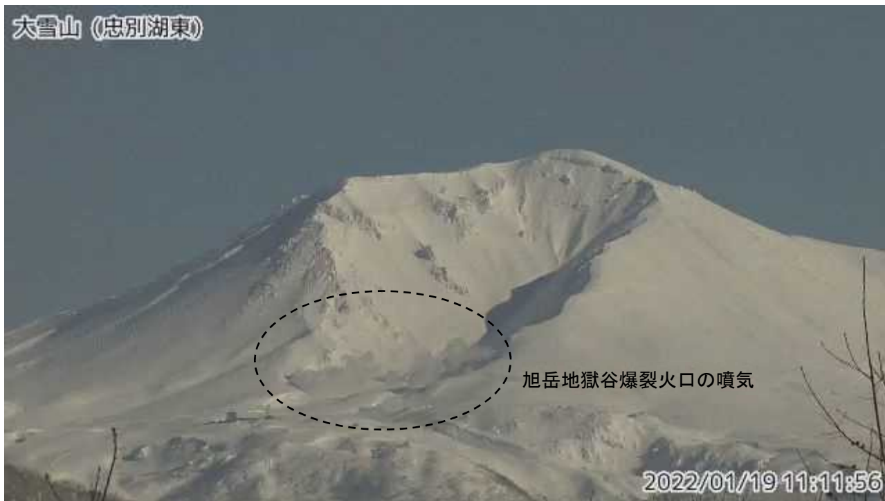
図2 大雪山 西側から見た旭岳の状況（忠別湖東監視カメラによる）