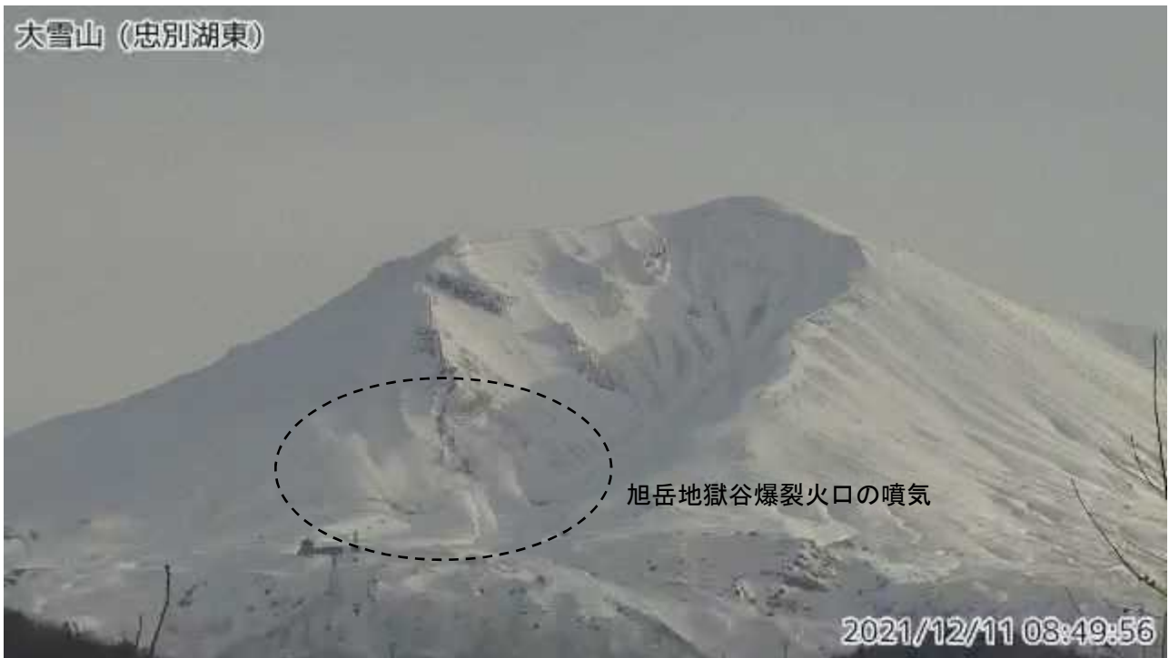
図2 大雪山 西側から見た旭岳の状況（忠別湖東監視カメラによる）