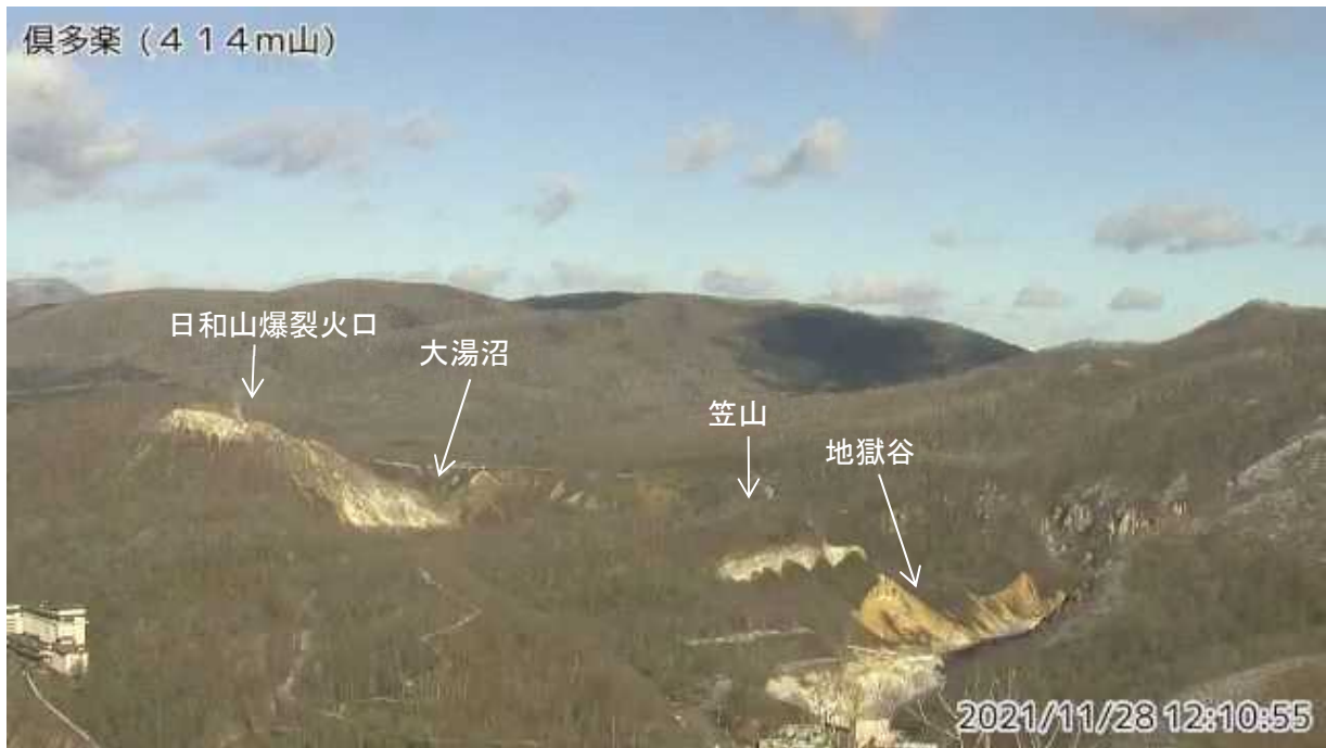
図1 倶多楽 南西側から見た日和山、大湯沼及び地獄谷周辺の状況（414m山監視カメラによる）