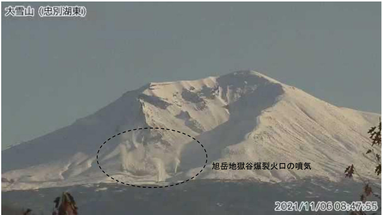
図2 大雪山 西側から見た旭岳の状況（ ちゅうべつこひがし 忠別湖東監視カメラによる）