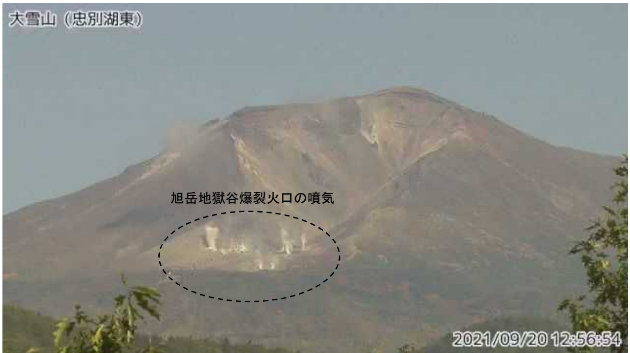
図2 大雪山 西側から見た旭岳の状況 (忠別湖東監視カメラによる)