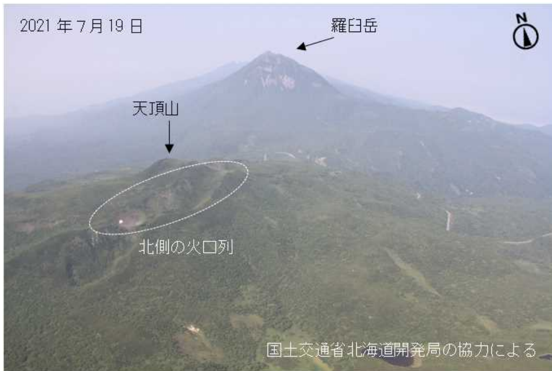
図2 天頂山 山頂付近及び北側の火口列の状況 南側上空（図1の①）から撮影