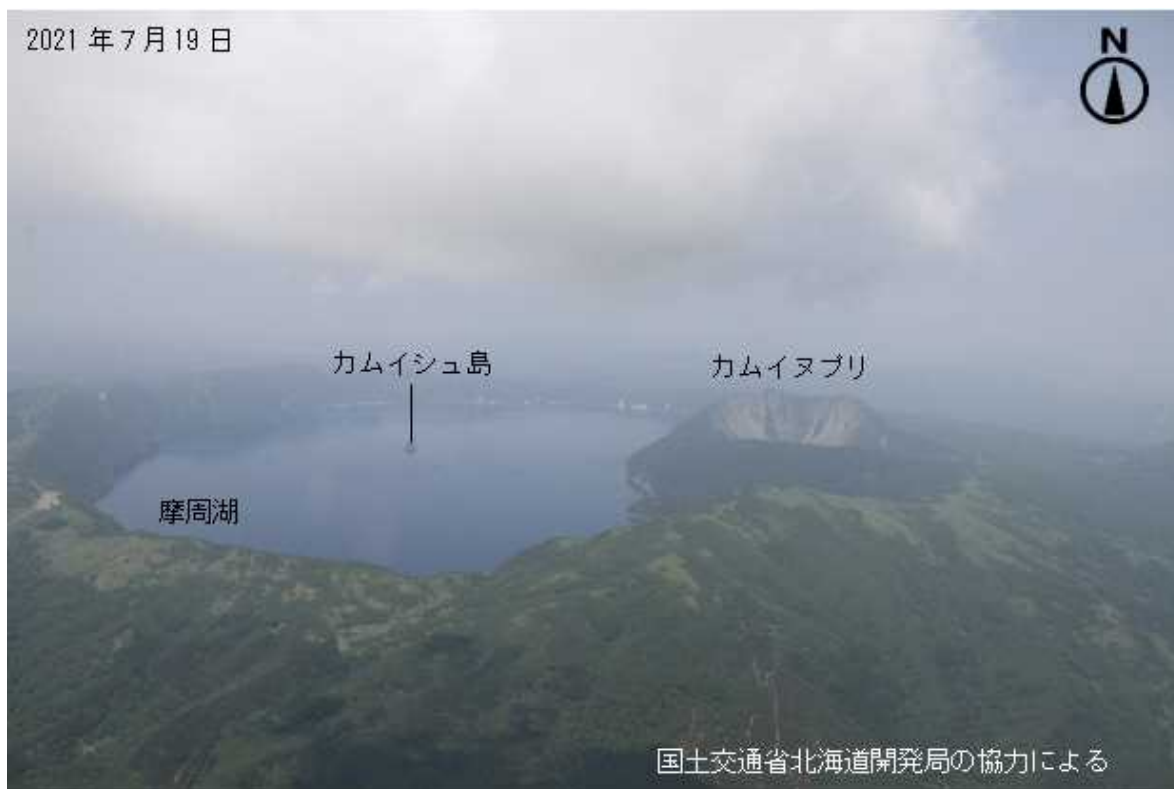
図2 摩周 摩周全体の状況 南側上空（図1の①）から撮影