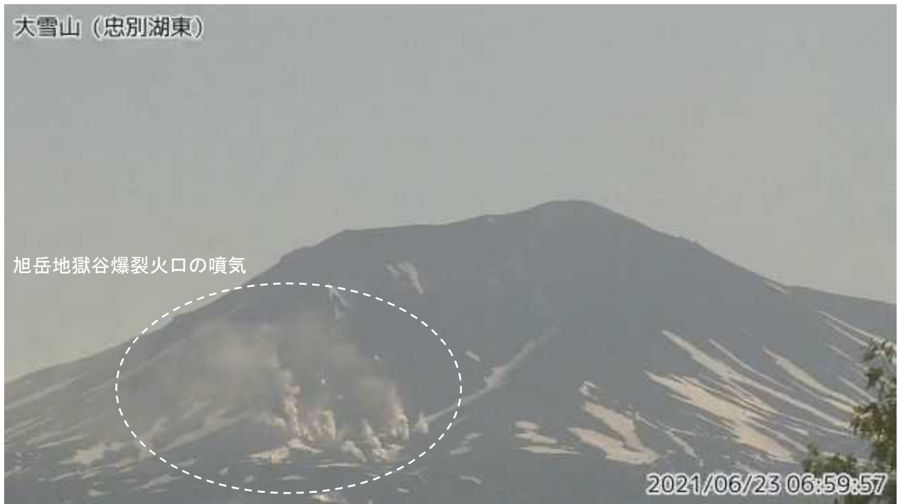
図2 大雪山 西側から見た地獄谷爆裂火口の状況（6月23日、 ちゅうべつこひがし 忠別湖東監視カメラによる）